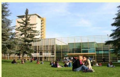
B.U. Droit -Lettres

Un étudiant nouveau venu à l'université doit découvrir très vite les principaux outils mis à sa disposition. La démarche la plus simple consiste à se tourner en priorité vers le Service Commun de la Documentation (SCD) .