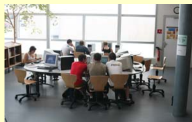
Bibliothèque de l'I.U.T. de Dijon

Bibliothèques de proximité des Unités de Formation et de Recherche (UFR).