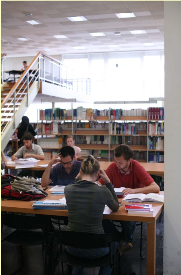
B2UFR : bibliothèque de Langues

Chaque bibliothèque est organisée de façon à favoriser l'accès à la documentation pour les lecteurs.